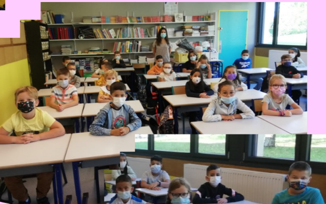
Line VINZIA CE1 et CE2